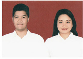
Komunitas Wilayah Kesetiaan