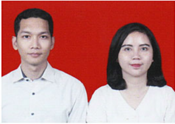
Komunitas Wilayah Kesabaran

Apabila tidak ada keberatan yang sah dari Jemaat, maka akan dilangsungkan Kebaktian Peneguhan dan Pemberkatan Nikah pada: