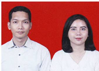
Komunitas Wilayah Kesabaran