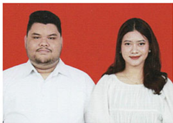
Komunitas Wilayah Murah Hati

Apabila tidak ada keberatan yang sah dari Jemaat, maka akan dilangsungkan Kebaktian Peneguhan dan Pemberkatan Nikah pada: